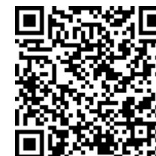
คู่มือ Wellness Hotel